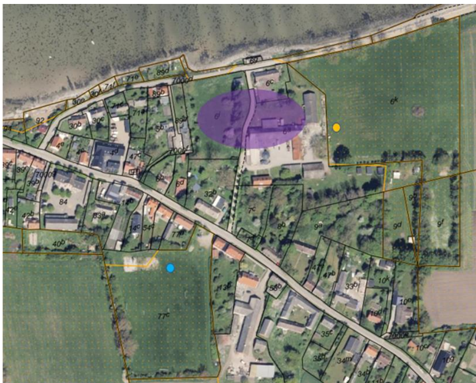
Fig. 1. Ortofoto 2024. Det orange prikkede område markerer det strandbeskyttede areal. De sorte streger markerer de vejledende matrikelskel. Den gule prik markerer matriklen samt placeringen af de to toiletvogne samt en badevogn. Den blå prik markerer matriklen, hvor det er ønsket at etablere det midlertidige campingområde med en toiletvogn og badevogn. Den lille markering viser placeringen af festivalen, der er beliggende uden for strandbeskyttelseslinjen.

I forbindelse med afholdelsen af Endelave Musikfestival, der er en to dages festival, er det ønsket at etablere et midlertidigt campingområde, opsætte tre toiletvogne og to badevogne inden for strandbeskyttelseslinjen på to forskellige matrikler. Selve festivalen er placeret udenfor strandbeskyttelseslinjen og afholdes på Endelave camping. Se figur 1.