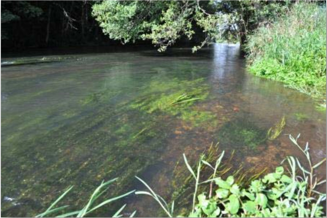
Figur 6. Lavvandet gydestryg i et større dansk vandløb, hvor åen er ca. 20 m bred. Her er der en stor naturlig produktion af ørred.