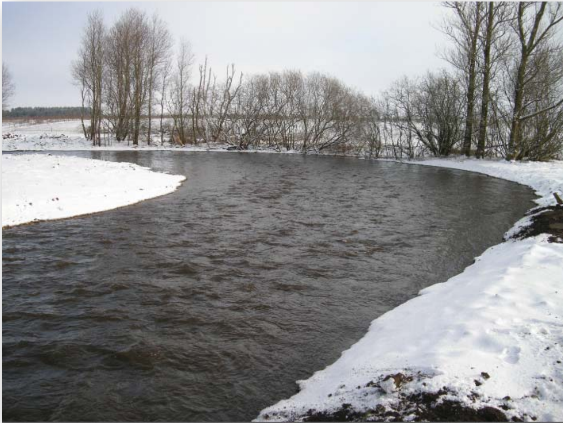
Figur 7. Ved Gelsbro Dambrug blev der i 2013 lavet et omløb, hvor Gels Å blev bredere og med lavere vanddybde og mindre fald. Lokalteter med lignende forhold giver både god passage for fisk og velegnede gyde- og opvækstområder og dermed grundlag for større naturlig produktion af fisk og smådyr (mere info i tabel 3).