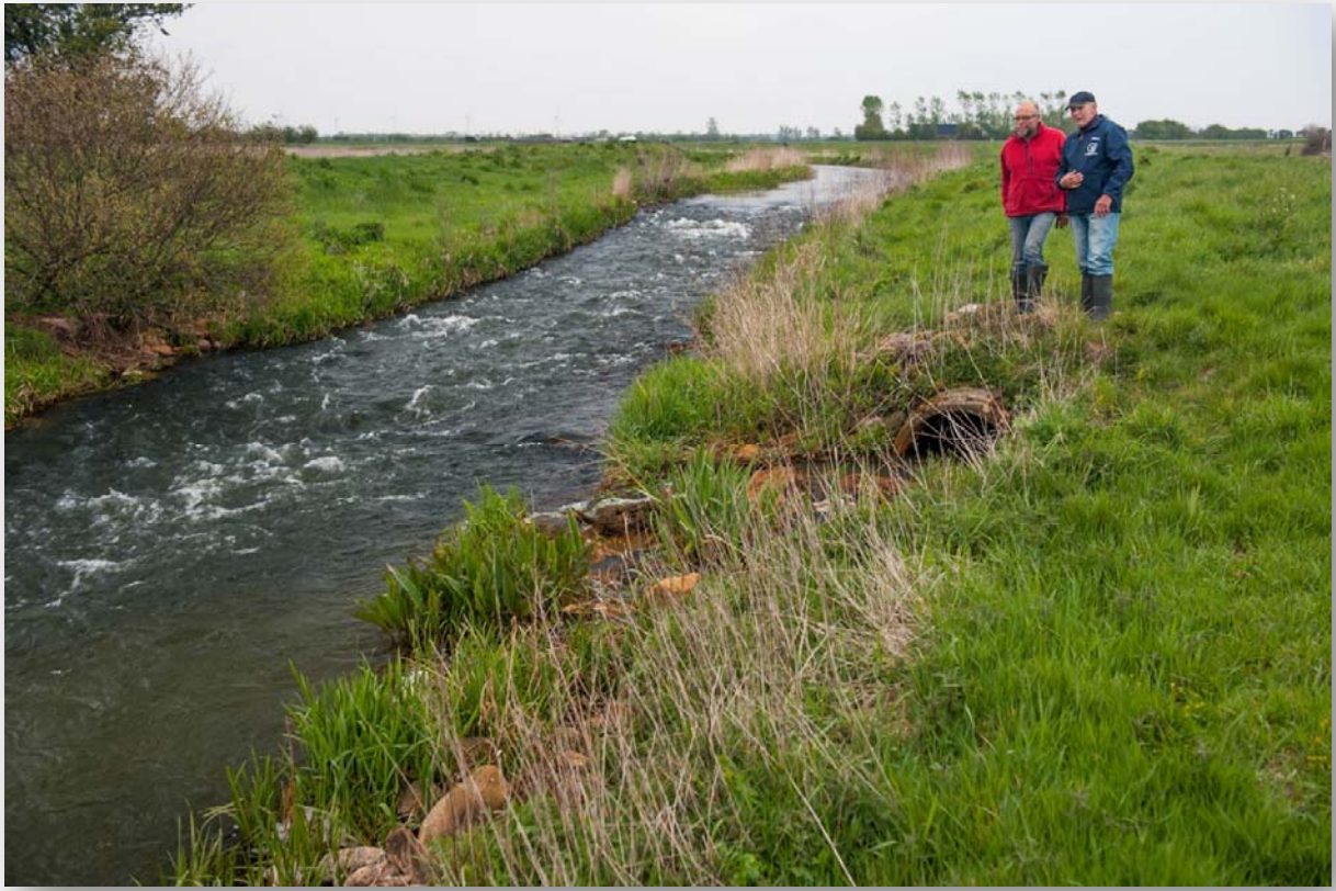
Figur 2. Dette stenstøvt er placeret få hundrede meter nedstrøms Toftlundvej. Nogle fiskearter kan stadig ikke passere disse stryg og meget få fisk kan gyde i disse stenstryg. Der er mange sådanne stenstryg i Gels Å (tabel 3).