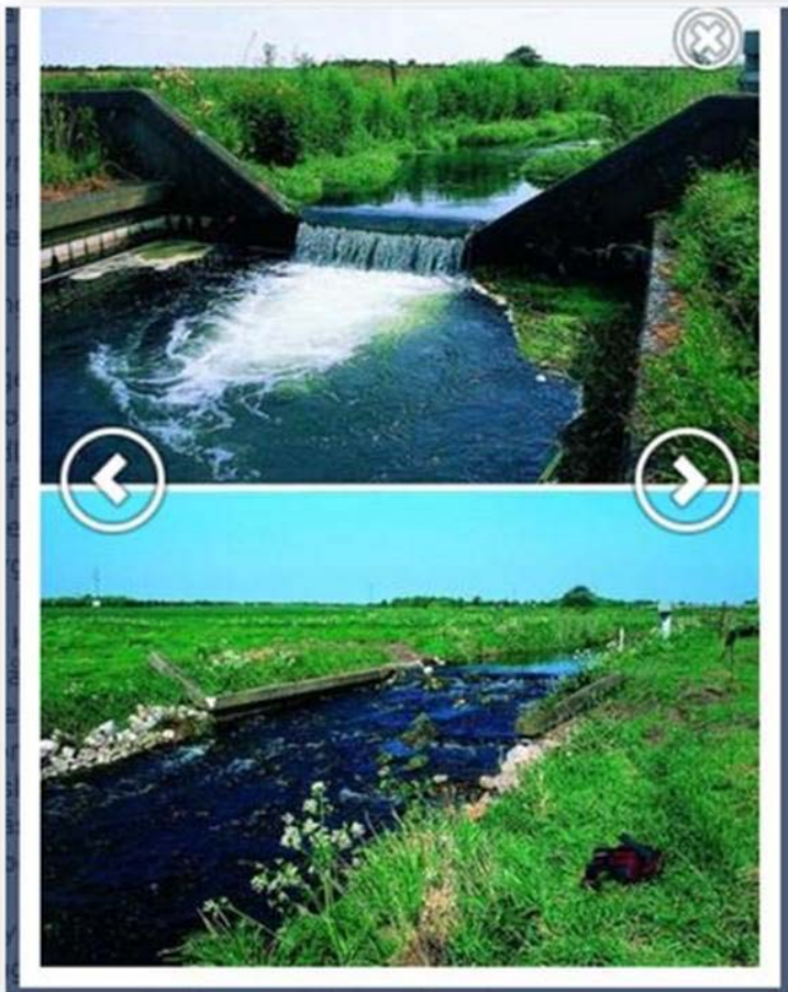
Figur 1. Øverst ses betonstøvt, som blev etableret i forbindelse med udretning af Gels Å i 1960'erne og nederst vises Sønderjyllands Amts ombygning fra betonstøvt til stenstøvt. Begge situationer viser kunstige og dårlige passage- og gydeforhold for laksefisk.