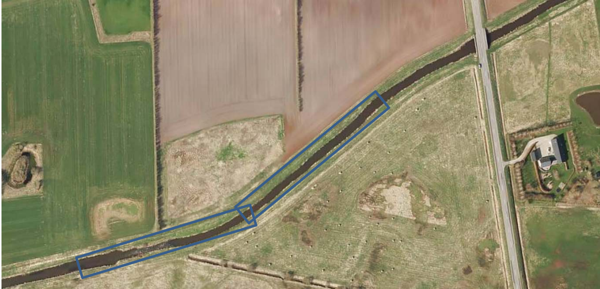
Figur 4. Principskitse hvordan et 50 cm fald kan udnyttes til at skabe et 250 meter langt gydestryg med 2 promilles fald og udvidelse til dobbelt bredde, for at opnå lav vandstand på stryget. Vandløbet er udvidet indenfor den blå markering.

Tiltag som udlægning af grusstryg i både hovedløb og tilløb vil genskabe egnede levesteder for fisk, smådyr og vandplanter. Egnede levesteder er en forudsætning for, at bestandene kan blive større og stærkere og på sigt klare sig uden udsætninger. Desuden vil biodiversiteten stige på restaurerede strækninger.