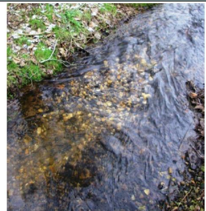
Antal naturlige havørredgydninger pr. tilløbene til Gudenåen hos BSF.